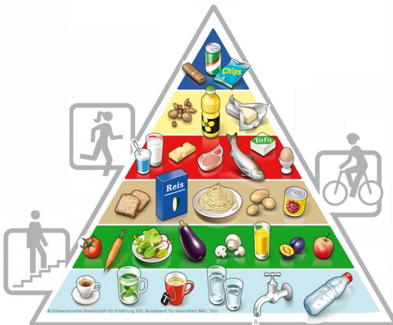
Lebensmittelpyramide für eine ausgewogene Ernährung

Eine gesunde Ernährung ist vielseitig und abwechslungsreich.